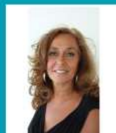
Medewerker Service Center